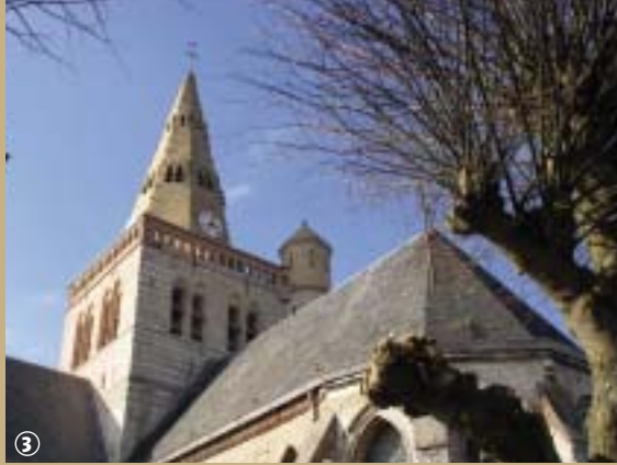
L'église de Cappellebrouck