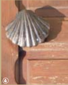
L'église de Cappellebrouck - coquille St-Jacques

La même année, Philippe d'Alsace fit à Compostelle un pieux pèlerinage, rapporta une relique du saint et l'offrit aux moines de Saint