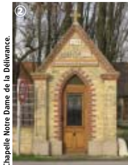
Chapelle Notre Dame de la Délivrance

Rédactrice : Fanny Fourquaux - Création : Atavia - Lille