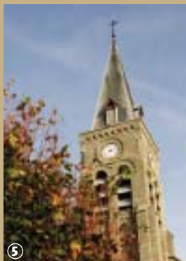
L'église de Drincham.

vous aimez pédaler, participez à cette manifestation autour du lin à la plante aux fleurs bleues où vous attendent des animations ainsi que des démonstrations de teillage de lin à l'ancienne.