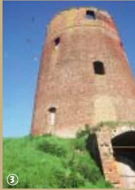
Moulin de briques.

Si la culture du lin se localise principalement sur une bande de 50 km de large, le long de la côte allant de Caen à Dunkerque jusqu'en Belgique et aux Pays Bas, savez-vous qu'il compte parmi les fleurons du Nord ?