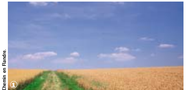
Chemin en Flandre.