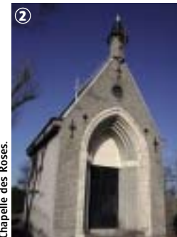
Chapelle des Roses.

L'avis du randonneur : Ce circuit campagnard chemine dans les terres fertiles de Flandre Maritime et, sur la première partie, souvent sur chemins agricoles. Le calme et le silence accompagneront le randonneur à travers les champs de blé où se détachent de petites collines semi-bocagères. Les chapelles rappellent l'histoire religieuse de ce pays. Grèbes et foulques naviguent le long de la colme. A mi parcours, un « café rando » permet une agréable pause. Le circuit peut se découvrir en deux boucles.